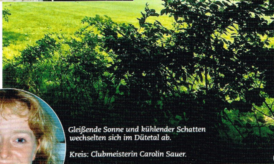
Gleißende Sonne und kühler Schatten wechselten sich im Dütetal ab.