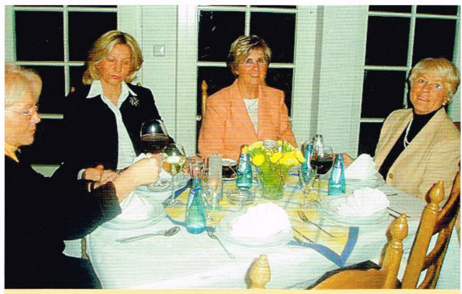
Winteressen der Damen im behaglichen Clubhaus im Dütetal.

In der HCP-Klasse B holten sich Ulrich (23,8) und Gabriele (24,1) Edeler den 1. Netto-Platz.