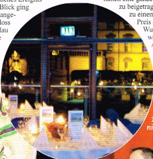
Schöner konnte die Kulisse für den 1. Dütetaler Golf-Ball nicht sein.

Novemberwetter! Aus der Tiefgarage am Osnabrücker Ledenhof kletterten warm verummte Gestalten, doch die langen eleganten Kleider deuteten darauf hin, dass in der Nähe ein festliches Ereignis wartete. Der Blick ging hinüber zum angestrahlten Schloss und auf die blau schimmernde Fassade des Kongress-Saales der Osnabrücker Stadthalle.