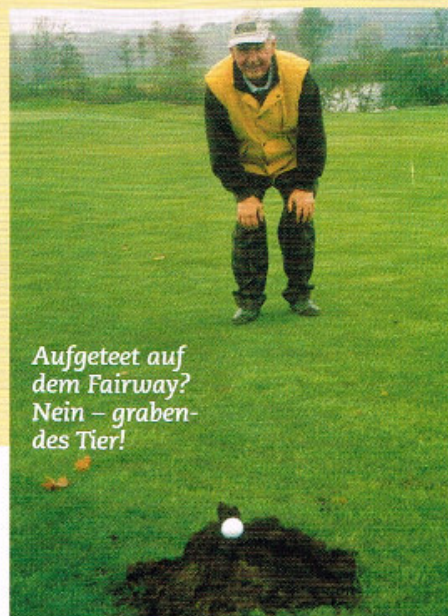
Aufgeteet auf dem Fairway? Nein – graben des Tier!