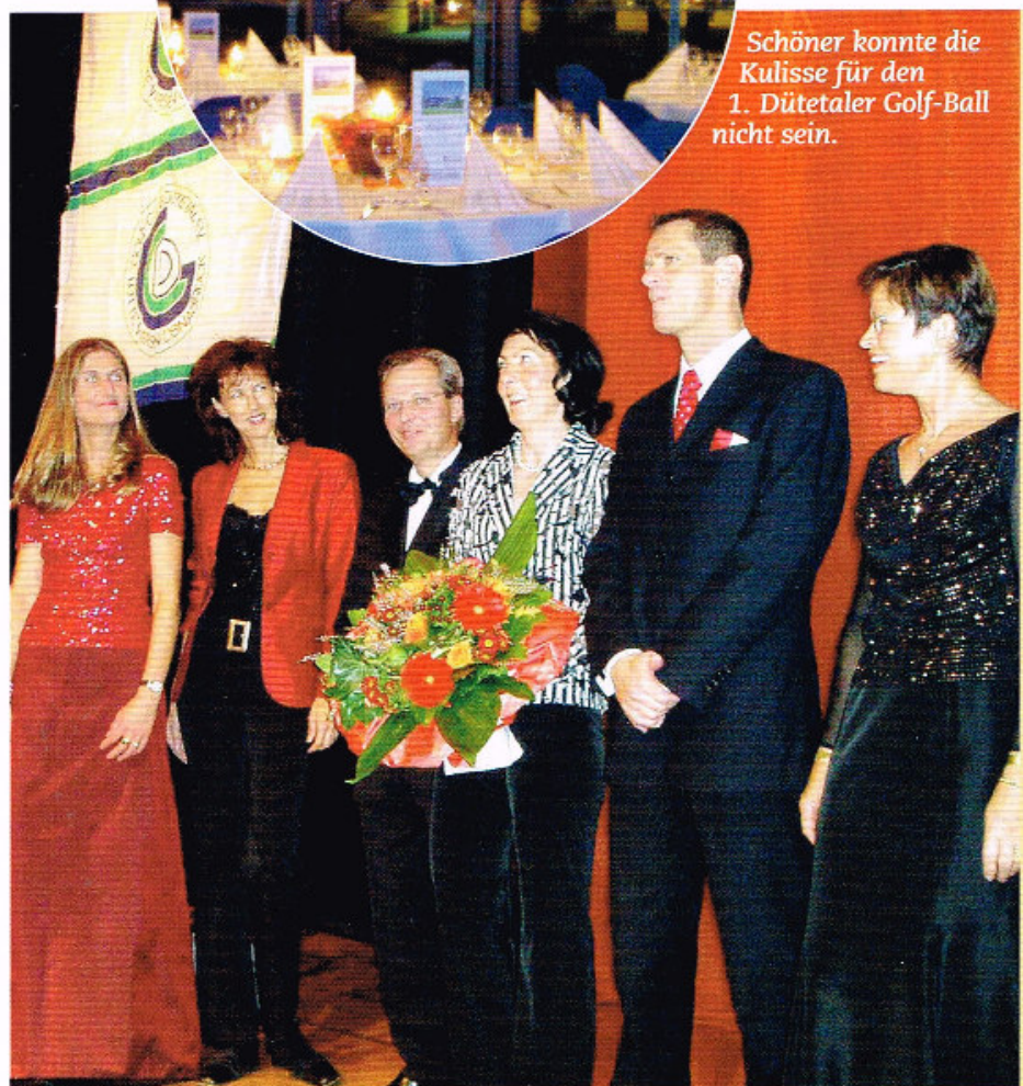
Die Organisatoren freuten sich über das begeisterte Echo.

Erwartungsvoll betreten wir die für uns neuen Räumlichkeiten, die einen ganz neuen Zuschnitt erhalten hatten und waren überrascht: Das Licht vieler Kerzen spiegelte sich in den zum Schloss liegenden hohen Fenster und den Gläsern auf den festlich gedeckten Tischen.